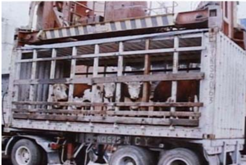
Side Open Container(20')